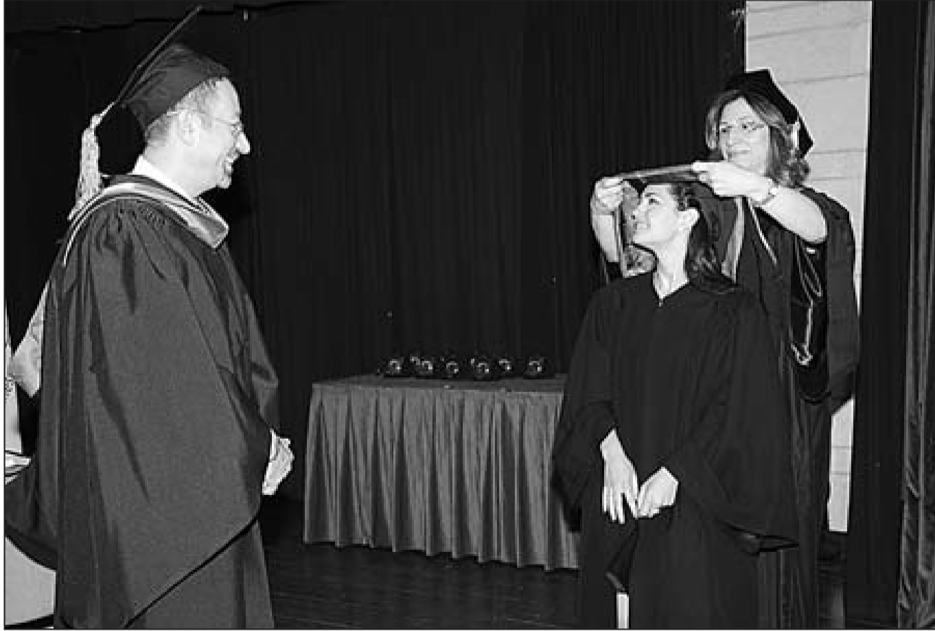
● الوشاح الأخضر لطالبة أنهت مرحلة الدكتوراه في الصيدلة

بعد النشيد الوطني، القى زلوعة كلمة قال فيها: «إن الخبرة التي اكتسبتموها في LAU