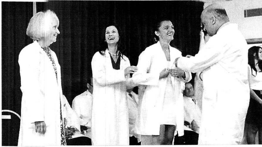
الرداء الأبيض لطلاب الطب في اللبنانية الأميركية.