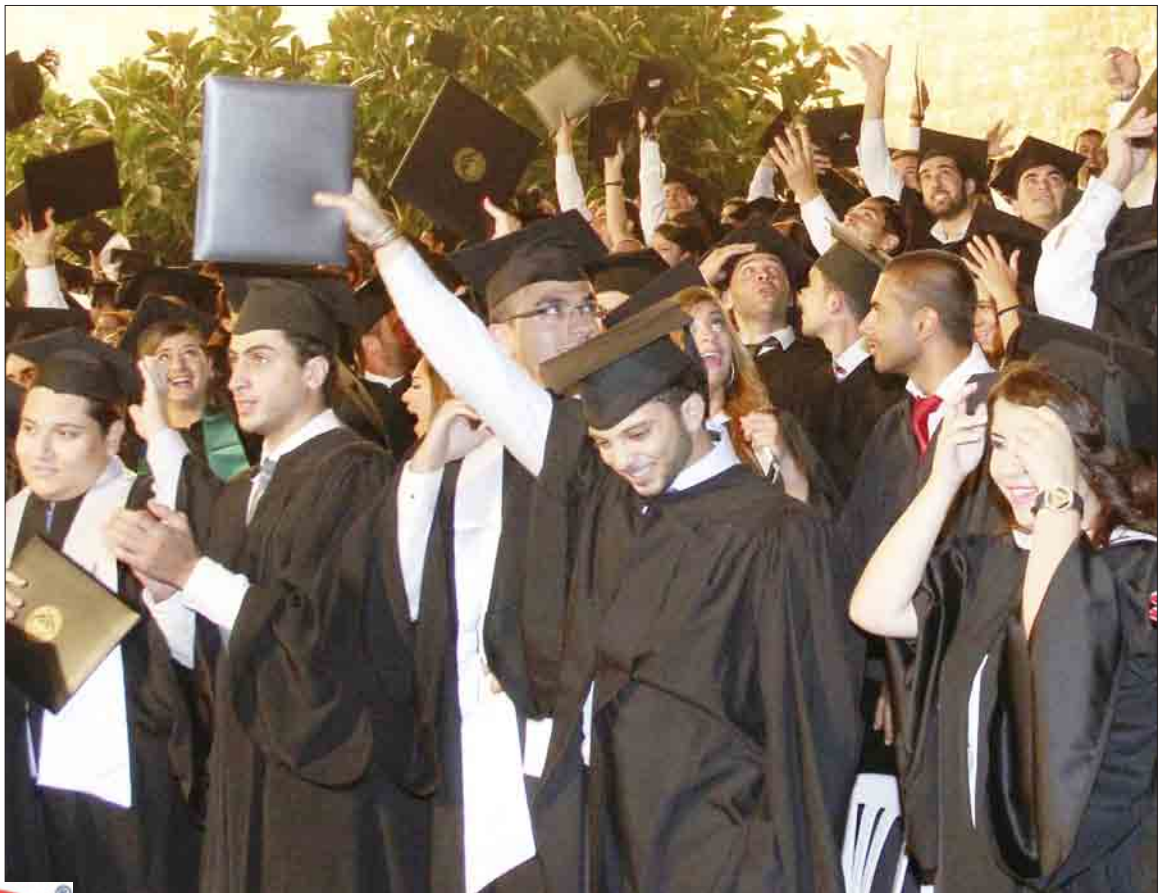
Students celebrate their commencement.