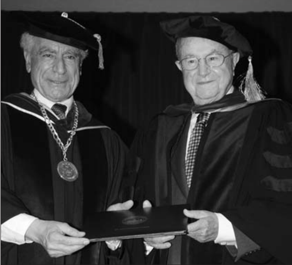
● خوري يتسلم الدكتوراه الفخرية من جبرا

تمسك بالعلم وسيلة للبقاء والمقاومة هو لا بد سيحقق أماله الوطنية إن عاجلاً أو آجلاً. وخاطب الخريجين قائلاً، «عليكم أولاً الأبتعاد عن الطائفية البغيضة فالدين لله والوطن للجميع، وعليكم ثانياً بالعلم، وعليكم ثالثاً بالصبر وهي خصلة عظيمة ونادرة».