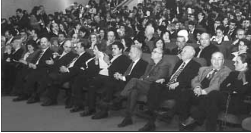
• الحضور •

أقامت الجامعة اللبنانية الأميركية (LAU) حفلها الختامي السنوي السادس للصفوف المتكاملة لبرنامج الأمم المتحدة للمرحلة الثانوية والسنوي الأول للصفوف المتوسطة لهذا البرنامج، في قصر الاونيسكو، حيث امتلأت مقاعد المسرح في كل الأجنحة كما الساحة الخارجية، بأكثر من 1000 طالب من المرحلتين المتوسطة والثانوية من المدارس الخاصة والعامّة في كل لبنان.