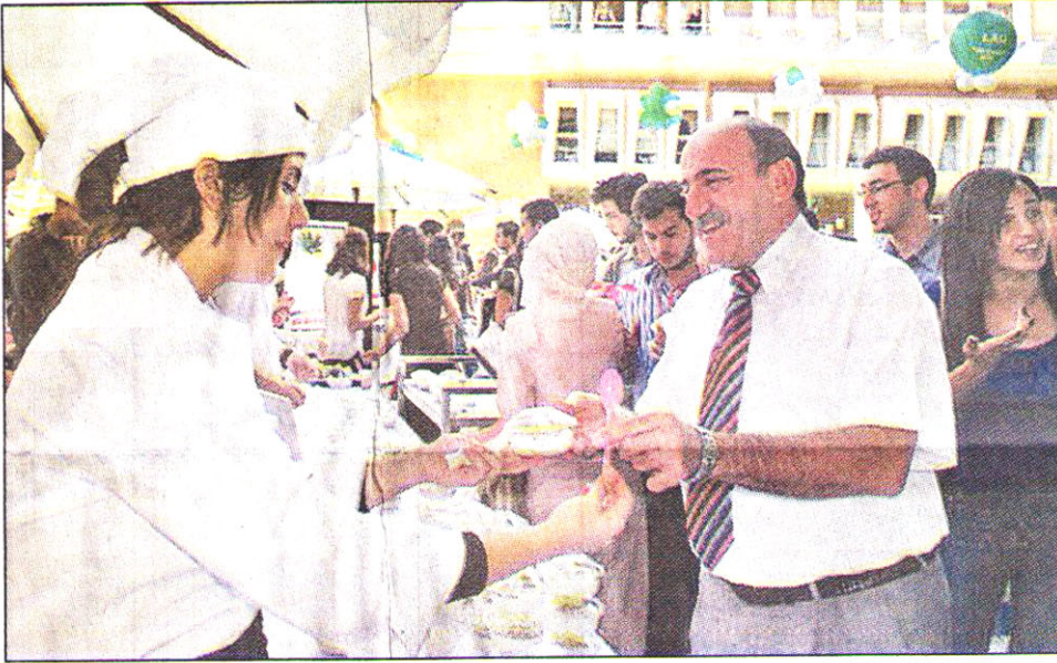
نعواس يتذوق نتاج الطلاب

أقام طلاب قسم برنامج ادارة الضيافة والخدمات في حرم بيروت في الجامعة اللبنانية الاميركية، صف تحضير الطعام والحلويات، حملة تحضير «السندويش الصحي»، حيث انهمك الطلاب في تحضير سندويشات غذائية بعيدة عن المواد الدهنية أو ذات السعرات الحرارية المرتفعة ليظهروا كيفية الحصول على وجبة غذائية كاملة وسريعة التحضير بفوائد غذائية مرتفعة.