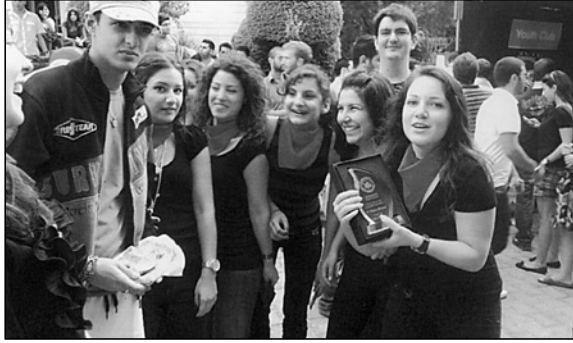
كعكة وجائزة *

أقام مكتب التوجيه في حرم جبيل في الجامعة اللبنانية الأميركية (LAU) لمناسبة «يوم الغذاء العالمي» مشروع (كعكتي (١٠) حيث تتنافس طلاب النوادي الطلابية في الحرم على تحضير ألد وأشهى وأسرع كعكة.