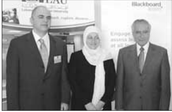
• الوزيرة الحريري متوسطة جبرا وكولينز •

القضية الأساس، فالمجتمعات التي تعتبر التعليم همها وقضيتها انما تعكس عن ارادتها بالتقدم والاستقرار والازدهار. وقالت: 'أتمنى لقمتمكم النجاح على امل أن نبلغ معا في وطننا ومجتمعنا قمة من الاستقرار والازدهار التي يحتاجها أبنائنا. وأتوجه بتهنئة خاصة الى منظمي هذه القمة مؤكدة لهم ترحيب لبنان واستعداده للتفاعل مع كل ما يخدم لبنان العلم والمعرفة والازدهار'. اما كولنز فقال: 'العمل مع بلاكورد يشكل امتيازاً، والامتياز هو في تخصيص وقت للتربية. ان عنوان الحلقة هو ضرورة تسهيل التعليم الكوني وعرض لتجربة بلاكورد في نشر التعليم الالكتروني، بحيث يستعمله حالياً أكثر من مليون انسان يومياً، علماً أن عدد المؤسسات المعتمدة لنظام بلاكورد فاق الأربعين ألفاً في العالم'. وازداد: 'ان للشركة نظام تواصل خلوي مركزه الولايات المتحدة، بالإضافة الى شبكة تلفزيونية متخصصة بالمقررات التعليمية ولاهداف محددة'. اشارة الى ان المؤتمر يعقد للمرة الأولى في لبنان، بعد ما كان المؤتمر الأول في دبي (٢٠٠٧) ثم في البحرين (٢٠٠٨)، وهو دليل على الايمان الراشح بالدور التربوي للبنان، مؤسسات تعليمية وجامعات تعليم عالي وتخصصي في منطقة الشرق الاوسط.