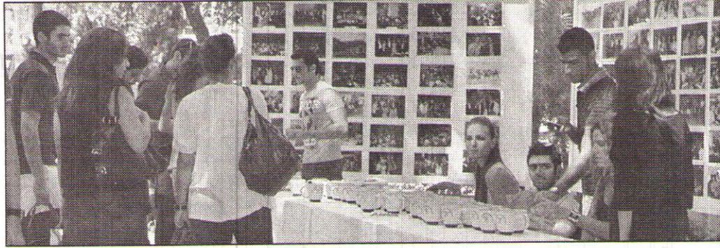
طلاب في حرم بيروت