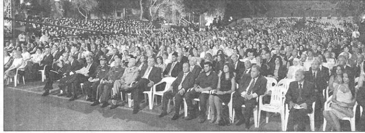
الحضور في حفل التخرج