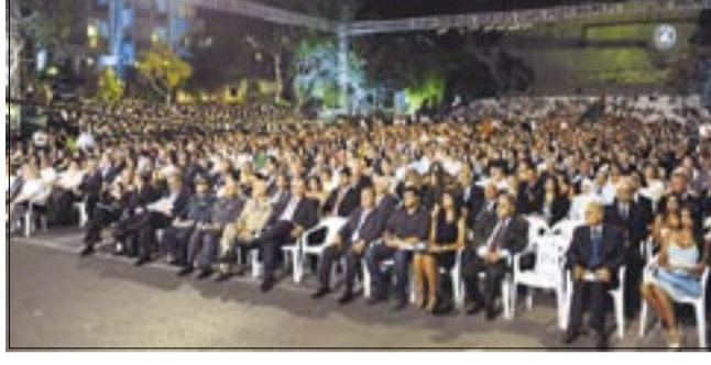
حشد في موقع الاحتفال.