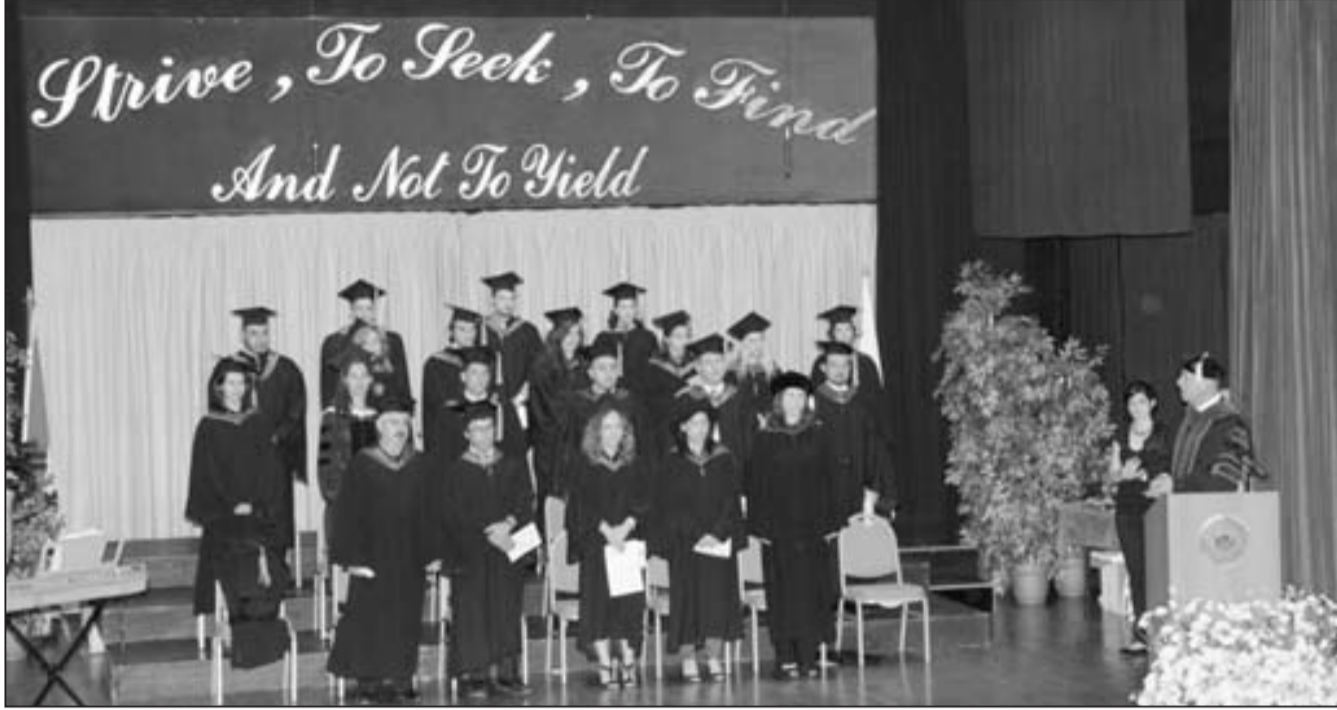
● جانب من المتخرجين في الحفل

مهنتهم ستزيدهم معرفة وتقدما. فتقدم التكنولوجيا ستساهم في المساعدة على إيجاد علاجات أفضل، وسيساهم في تغيير طريقة ممارستنا لمهنة الصيدلة بشكل جذري. فالعلم لا يحد والنظام الصحي يتطور بسرعة ويفرض متابعتهم.