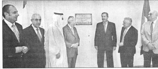
الوفد الاماراتي امام قاعة الشيخ زايد