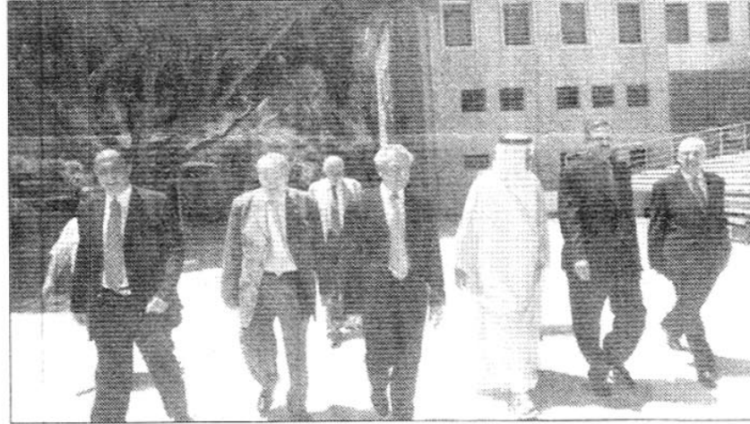
الوفد الإماراتي متفقاً أرجاء الحرم

استقبل رئيس الجامعة اللبنانية الأميركية LAU الدكتور جوزف جبرا، وزير العمل في الامارات العربية المتحدة صقر غباش يرافقه سفير الامارات في لبنان رحمة حسين الزعابي ورئيس مجلس العمل اللبناني في أبو ظبي رجل الأعمال السيد البيرمتي.