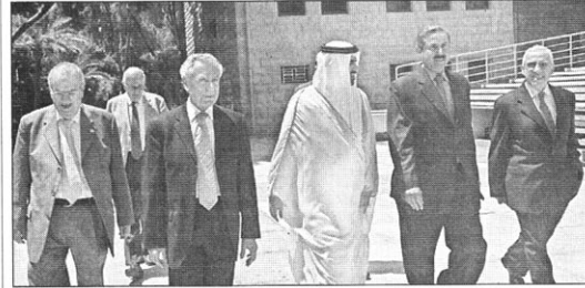
اثناء الجولة في حرم الجامعة

سئل كيف وجدت مستوى التعليم العالي في LAU؟ أجاب: بصفة عامة، فإن مستوى التعليم الجامعي في لبنان مميز، وخير دليل على ذلك أن الخريجين اللبنانيين لا يجدون صعوبة في الحصول على فرص عمل في أي مكان في العالم. وبالتأكيد فإن هذه الجامعة هي من بين الجامعات المتميزة، والتعليم العالي في لبنان لا يزال مميزاً بين الجامعات في العالم العربي، والجامعات التي ارتبطت أيضاً بالغرب استفادت بشكل ايجابي أكبر وعززت من قدراتها التعليمية.