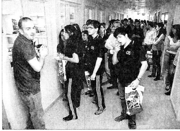
تلامذة في قسم الادارة الفندقية في الجامعة.

الحرم، كما تولى قسم الرياضة تنظيم فترة ترفيهية للتلامذة. ونظم اليوم المفتوح بعنوان: "أنت في LAU: معرفة أكثر لقرار أفضل".