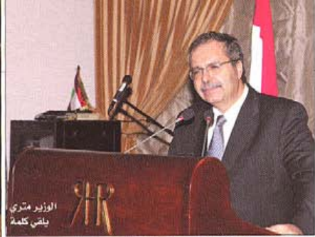
الوزير متري يلقي كلمة