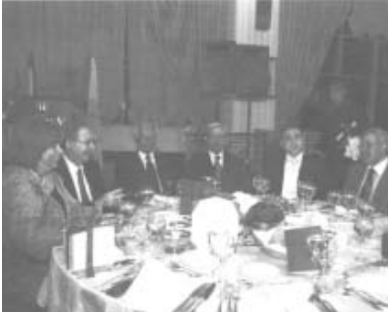
الوزراء متري وصلوخ واوغاسبيان وجبرا خلال الاحتفال

هو الذي يتيح للإعلاميين ان يقوموا بواجبهم على احسن وجه»، وقال: «ان لقاء هذا العدد الكبير من الاعلاميين والاعلاميات يزيدنا اقناعاً باننا معاً اذاما تناصرنا وإثقلنا في اتحاد مهني يليق بالاعلاميين والاعلاميات. نستطيع أن نحقق استقلالاً أكبر وقدره أكبر على ممارسة مهنتنا وتعزيز صدقية إعلامنا وهي شرط اول من شروط حريته». وكان قدم الحفل مدير العلاقات العامة والاعلام في الجامعة الزميل كريستيان أوسي».