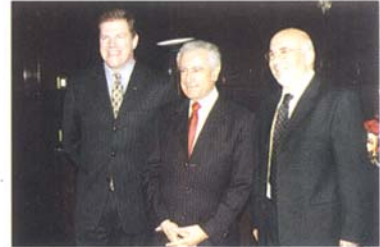
مع الرئيس جبرا في الاستقبال