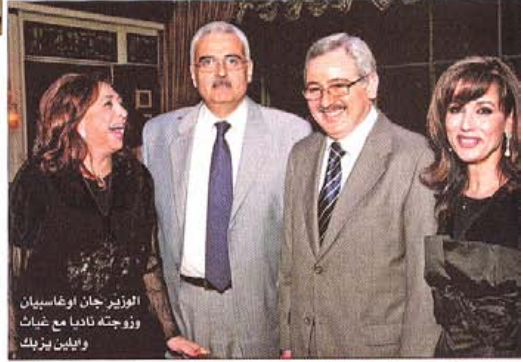
الوزير جان اوغاسبيان وزوجته ناديا مع ضيافات وايدين ليزريك

اقامت الجامعة اللبنانية الاميركية (LAU) حفلاً تكريمياً للاعلاميين في فندق لورويال - ضييفة حضره وزير الاعلام طارق متري، وزير الخارجية فوزي سلوخ ووزير الشؤون الاجتماعية ماريو عون ووزير الدولة جان اوغاسبيان، وتمثل نائب رئيس الوزراء عصام ابو جعرا بمستشاره ايلي حنا ووزير الدفاع الياس المر بمستشاره الاعلامي جورج سولاج، الى نقيب الصحافة محمد البعلبكي، فيما تمثل نقيب المحررين ملحم كرم بالزميل كريستيان اوسي، وحضر الحفل ايضاً حشد كبير من الصحافيين والاعلاميين من مختلف وسائل الاعلام، مؤسسات تلفزيونية واذاعية وصحف ومجلات ووكالات انباء. وكان للوزير متري كلمة في الحفل أكد خلالها على ان، لا خوف على حرية الاعلام في لبنان على الاطلاق رغم انزلاق البعض الى كلام تهكم وتهجم كما ينزلق السياسيون ومعهم قلة من الاعلاميين الى العنف المعنوي والى قلة الادب. فيما أكد نقيب الصحافة البعلبكي بدوره الحرس على ان تقوم الصحافة بدورها التاريخي كفيمة على الحياة الوطنية والمناقب والاخلاق السياسية، وأضاف: «تجاوز اخلاقيات السياسة والمهنة لا يشرف صاحبه ولا يليق ايضاً لابه ولا بلبنان.. وكان لرئيس الجامعة اللبنانية الاميركية الدكتور جوزف جبورا كلمة توجه فيها الى الاعلاميين قائلاً: اتمم تشيرون الحرف ونحن نثقّف العقل والنفس ونحضر جيل المستقبل لمواكبة تحديات المجهول والتقلب عليها.