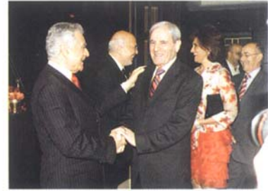
مع الوزير صلوخ