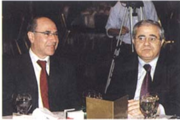
الزميل جورج سولاج مع الوزير ماريو عون

أقامت الجامعة اللبنانية، الأميركية عشاءها التكريمي السنوي للإعلاميين اللبنانيين في فندق "كو رويال". ضييفة في حضور الوزراء طارق متري وفوزي صلوخ وجان أوغاسبيان ونقيب الصحافة محمد البعلبكي وحشد من أهل الصحافة المرئية والمسموعة والمقروءة. وقد ألقى وزير الإعلام طارق متري كلمة في المناسبة سبقة إليها رئيس الجامعة الدكتور جوزف جبرا وأعقبه النقيب بعلبكي في مواقف شددت على الدور الريادي للجامعة اللبنانية، الأميركية ووسائل الإعلام في نهضة الشعوب والدول، وبناء الأجيال على أسس سليمة وصحية وعلمية بعيدة من التجاذبات والنزاعات والمؤثرات السلبية.