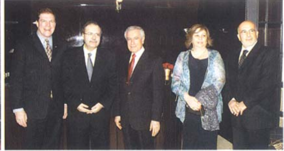
مع الوزير متري