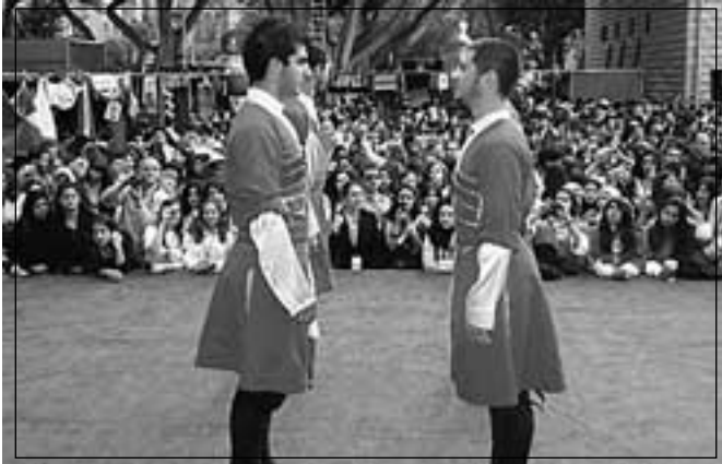
• القرية الكونية: طلاب وعرض راقص •

التقى أكثر من ألف طالب ثانوي من مدارس مختلفة من لبنان في العالم مصغر نقل صوراً حية عن ٦٣ دولة في العالم بالباحة الكبرى بحرم بيروت في الجامعة اللبنانية الأميركية LAU لآحياء فكرة القرية الكونية من ضمن برنامج نموذج الأمم المتحدة الذي درجت الجامعة اللبنانية الأميركية على إقامته للسنة الرابعة على التوالي وبمشاركة مؤسسة الوليد بن طلال ابتداءً من هذه السنة.