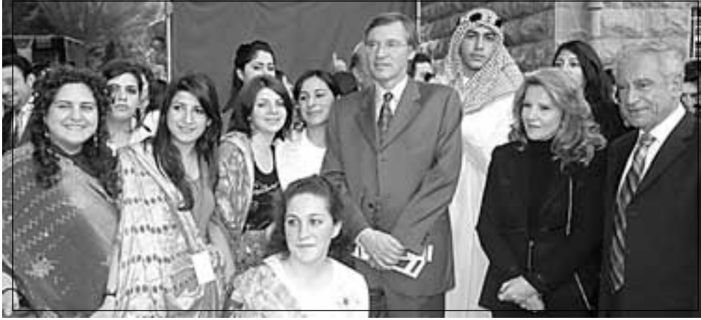
• جبرا، الوزيرة الصلح وسفير سويسرا مع الوفد الهندي •