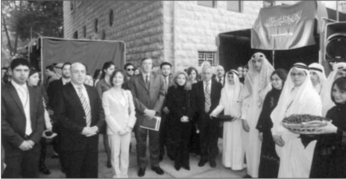
● امام جناح الوفد السعودي

أحييت الجامعة اللبنانية الأميركية ((LAU فكرة «القرية الكونية» المخصصة لتلامذة الصفوف الثانوية في مختلف مدارس لبنان، ضمن برنامج نموذج الأمم المتحدة، الذي درجت الجامعة اللبنانية الأميركية على إقامته للسنة الرابعة على التوالي، بمشاركة «مؤسسة الوليد بن طلال» ابتداءً من هذه السنة. وقد عمل نحو ألف طالب على نقل صورة حية عن 63 دولة في العالم. فانتشرت الخيم وصدحت الموسيقى، وظهر الطلاب بالأزياء الفولكلورية لدولهم، وقدموا الأطعمة التقليدية لهذه الدول، وجهدوا لتقديم لوحات تراثية سعوا إلى أن تأتي مطابقة لروحية الدول التي مثلوها. حضر النشاط الذي أقيم في الباحة الكبرى للجامعة حرم بيروت سفير سويسرا فرنسوا باراس، نائبة رئيس مؤسسة الوليد بن طلال الوزيرة السابقة ليلي الصلح حمادة ومدير المؤسسة للشؤون التربوية عبد السلام ماريني وعدد من ممثلي البعثات المعتمدة في بيروت. وكان في استقبال المشاركين رئيس الجامعة جوزف جبرا ونائبة الرئيس لشؤون الطلاب الدكتورة أليز سالم ومدير البرنامج ايلي سميا ومسؤولون في الجامعة، بحضور طلاب سكرتارية الأمانة العامة لنموذج الأمم المتحدة. وتحدث السفير السويسري عن «أهمية سويسرا في