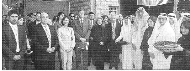
امام الجناح السعودي

التقى أكثر من ألف طالب ثانوي من مدارس مختلفة من لبنان في عالم مصغر نقل صوراً حية عن ٦٣ دولة في العالم، في الباحة الكبرى في حرم بيروت في الجامعة اللبنانية- الأميركية، لآحياء فكرة القرية الكونية من ضمن برنامج نموذج الأمم المتحدة الذي درجت الجامعة اللبنانية الأميركية على إقامته للسنة الرابعة على التوالي.