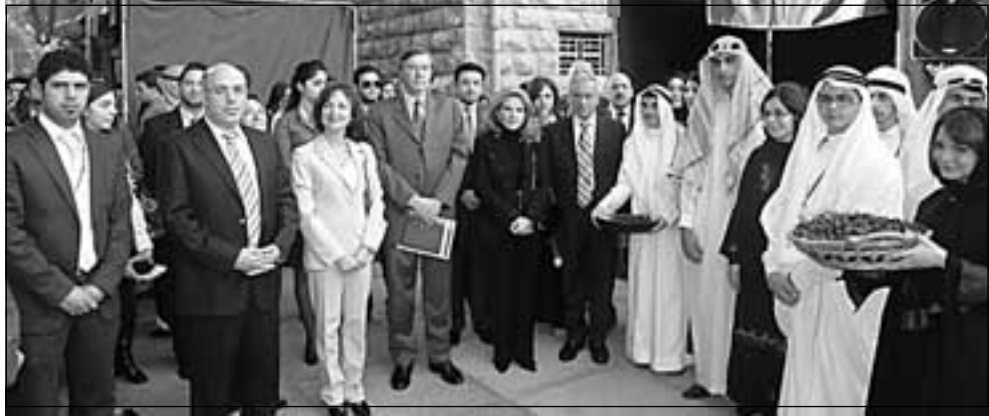
• امام جناح الوفد السعودي •