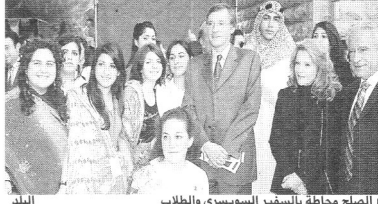
الصلح محافظة بالسفير السويسري والطلاب