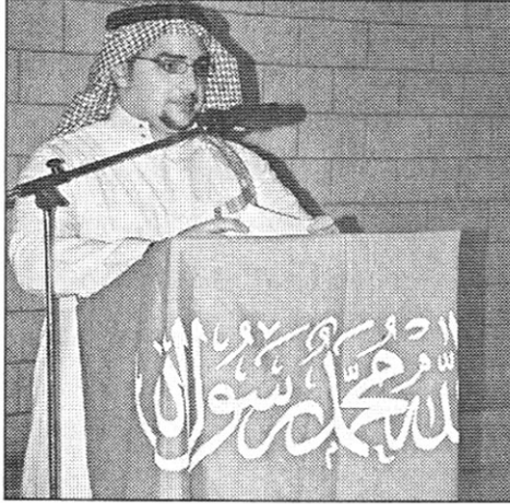
رئيس النادي الثقافي السعودي يلقي كلمته

ألقى كلمة أشاد فيها بالجهود التي بذلها الطلاب أعضاء النادي الثقافي السعودي في الجامعة لكي يبرزوا هذا الجانب الحضاري من الحياة الاجتماعية في المملكة العربية السعودية. وأكد أن ما حدث إنما هو ترجمة طبيعية لعلاقة وطيدة قائمة بين هذه المؤسسة الأكاديمية الراقية والمملكة، متمنياً التوفيق للطلاب في سعيهم الأكاديمي وفي نشاطهم الاجتماعي.