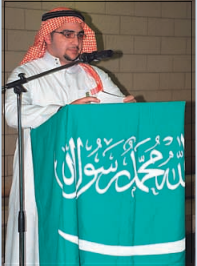
* رئيس النادي الثقافي السعودي في LAU.*