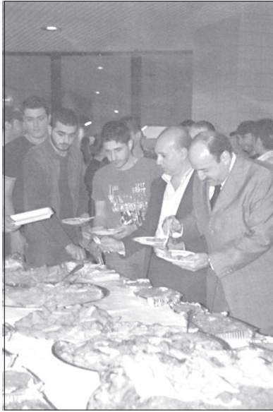
يتذوقون المأكولات السعودية

قائمة بين هذه المؤسسة الأكاديمية الراقية والمملكة. متمنياً التوفيق للطلاب في سعيهم الأكاديمي وفي نشاطهم الاجتماعي.