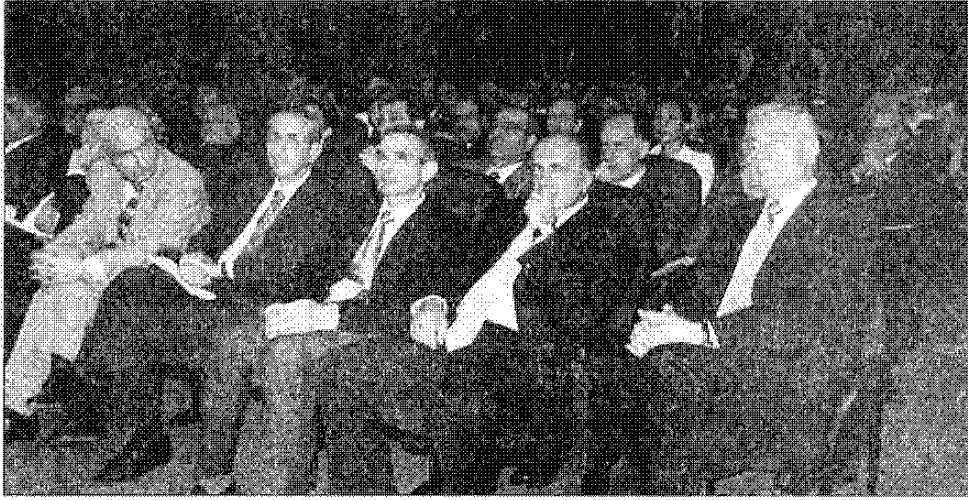
جانب من الحضور في ورشة العمل