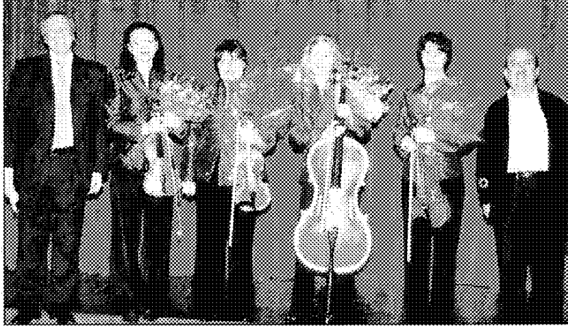
• الرباعي الوتري الروسي بين خليفة وشومان •