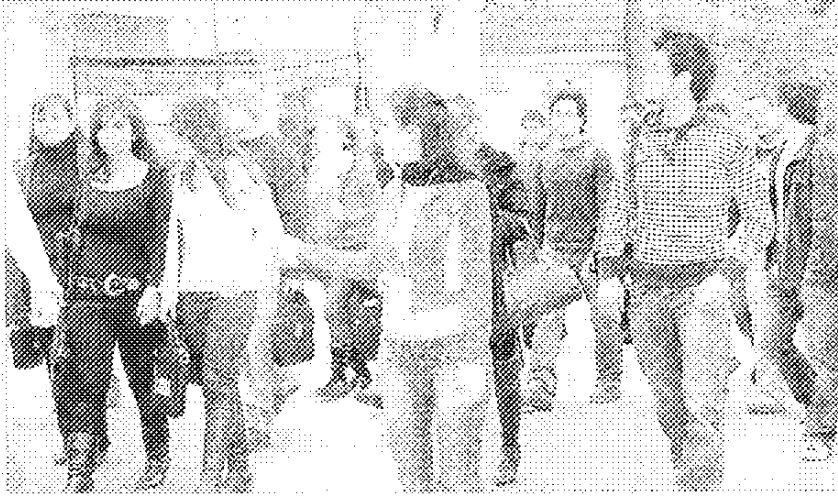
خلال جولة في حرم بيروت.

استقبال بعد الظهر لذوي الطلاب، في اجواء موسيقية عبققت في اجواء الحرم وقدمها طلاب "نادي الموسيقى" في الجامعة.