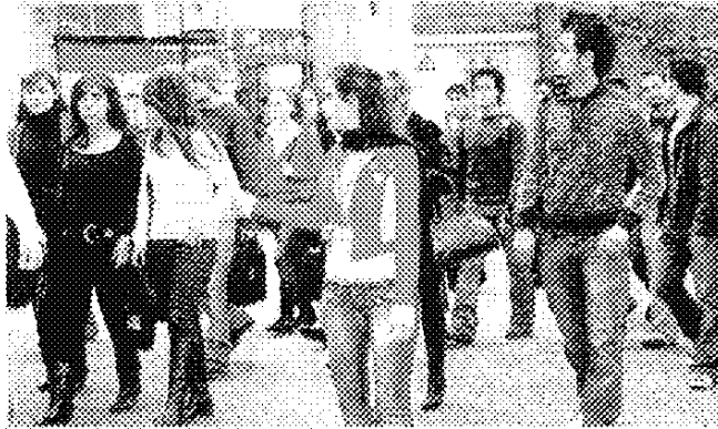
جولة للطلاب داخل حرم الجامعة

نظمت الجامعة اللبنانية الأميركية (LAU) في كل من حرميها في بيروت وجبيل، يوماً توجيهياً لطلابها الجدد الذين سيلتحقون بالفصل الدراسي المقبل، بهدف تعريفهم إلى الجامعة واختصاصاتها والمواد التعليمية، وتمكينهم من تحديد اختياراتهم بما يتناسب ومهاراتهم وكفاءاتهم العلمية.