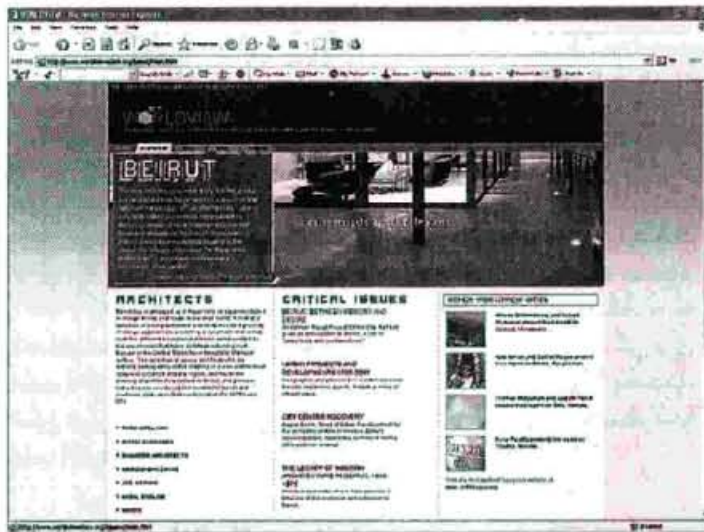
بيروت في الموقع الإلكتروني.